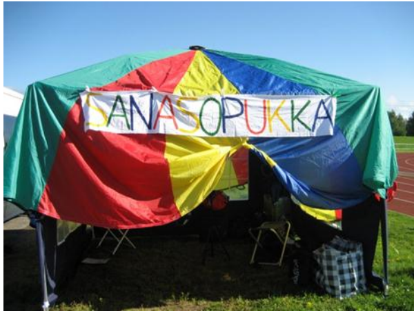
Kuva 1. Sanasopukka-telttä

Sanasopukan halusimme myös jollakin tavalla tuovan mielikuvan laskuvarjosta ja siten yhdistyvän Tandem-projektiin, joten telttamme katto ja seinät muodostuvat suuresta leikkivarjosta silloin, kun telttia on pystytetty sisätiloihin. Ulkona ollessamme meillä oli myös käytössä ns. normaalit telttan seinät. (kuva 1.)